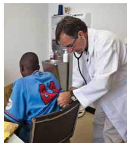
Campanha de vacinação contra a poliomielite

No contrato de extensão da concessão do Bloco O, prorrogado até 2030, a CABGOC e os seus parceiros decidiram atribuir USD 80 milhões como bónus social. Este montante