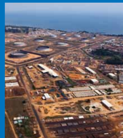
Vista aérea do Terminal do Malongo

‘Tentamos nunca nos esquecer de por em prática o princípio operacional O que você vê passa a ser responsabilidade sua.’