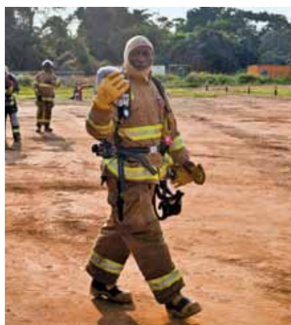
Para cada tarefa, o equipamento adequado