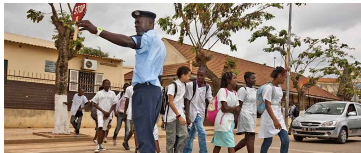
A comunidade e os agentes de trânsito trabalharam juntos para o êxito do programa de segurança rodoviária