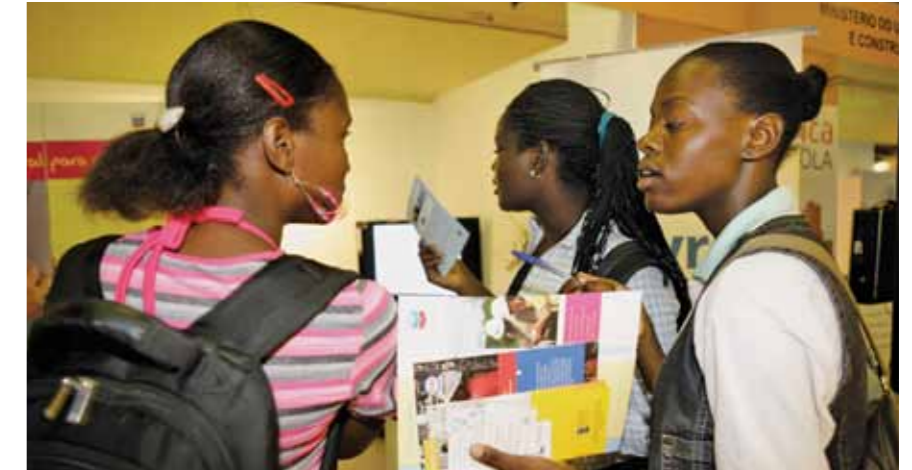
Potenciais candidatos numa feira de emprego

Lançada a construção de um centro de recursos de professores nas províncias de Luanda e do Cunene, para facultar espaços para os professores melhorarem as suas aptidões de informação tecnológica.