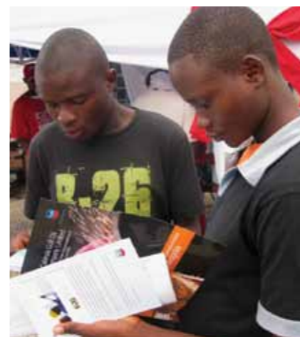
Dois participantes na feira de sensibilização sobre o VIH/SIDA, em Cabinda

Em 2010 a CABGOC prosseguiu com o apoio aos esforços governamentais na batalha contra o VIH/SIDA e a facultar ajuda aos infectados e afectados pela doença pandémica. A companhia