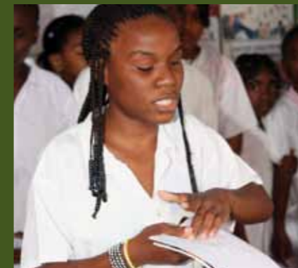
Aluna da Escola Óscar Ribas a ler texto em Braille

‘Tenho a certeza de que de agora em diante vou agarrar-me a estes livros.’