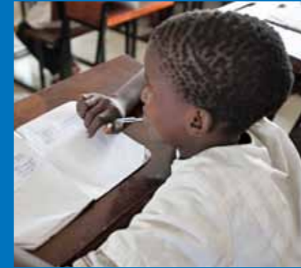
Alunos e professores participaram activamente no concurso de escrita

‘Tenho a certeza de que de agora em diante vou agarrar-me a estes livros.’