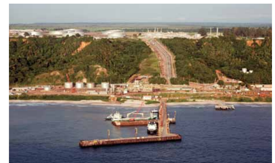
Terminal do Malongo