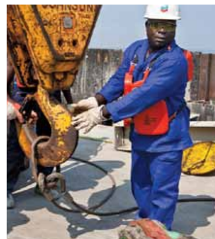
Faça de forma segura, ou não faça