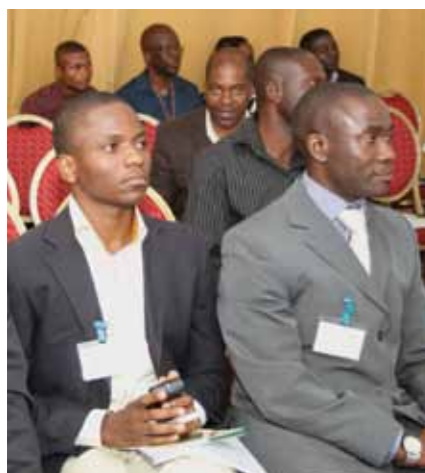
Plateia muito atenta, num evento do CAE