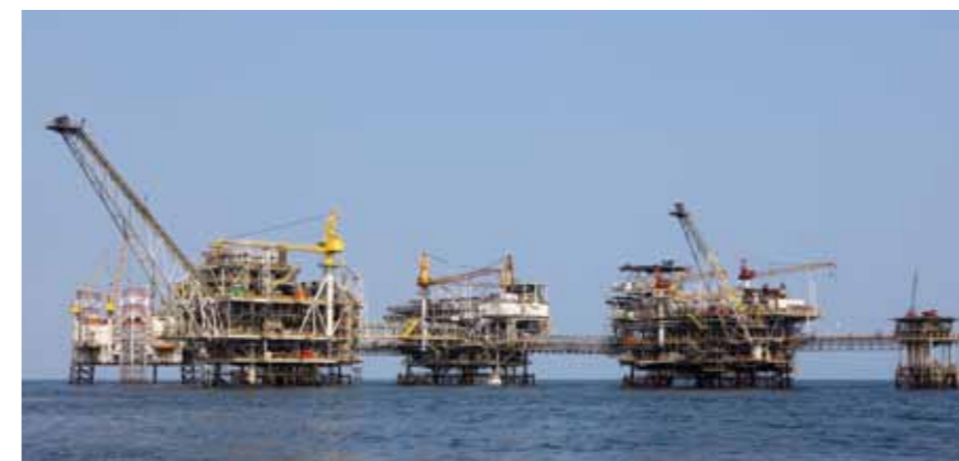
Complexo da Plataforma de Takula

Somos o maior empregador estrangeiro da indústria petrolífera, com aproximadamente 3.130 empregados angolanos - cerca de 88 por cento da nossa força de trabalho no país. Adicionalmente, os angolanos ocupam cerca de 76 por cento das posições locais profissionais e de supervisão da Chevron.