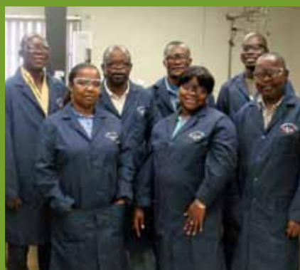
Equipa do Laboratório do Malongo

‘O nosso objectivo é tornar o Laboratório de Malongo conhecido como o melhor em África e atingir um desempenho de excelência a nível mundial.’