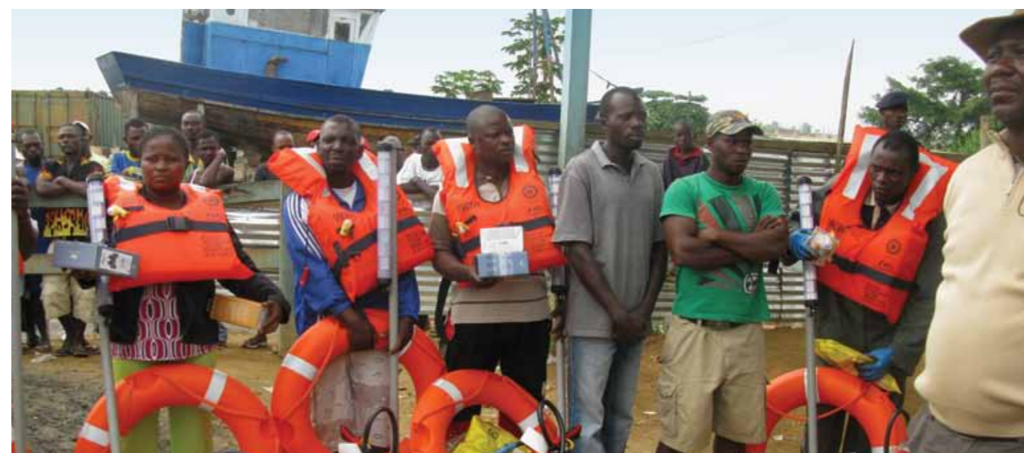
Membros da comunidade piscatória na cerimónia de entrega do equipamento