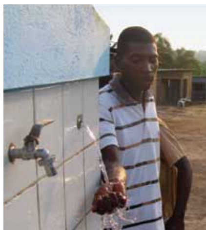
Água potável para a comunidade