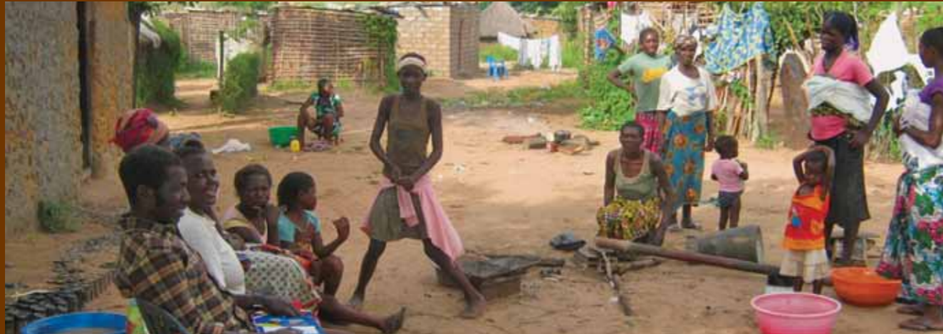
Reunião com a comunidade