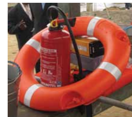
Amostra do equipamento doado

A CABGOC distribuiu radares reflectores, equipamento de segurança e de protecção, GPS e outras ferramentas de navegação e conjuntos de primeiros socorros, a mais de 2.000 pescadores organizados. O equipamento é para ser instalado em cerca de 400 barcos de pesca na região de Tieiro Norte e Sul, em Cabinda.