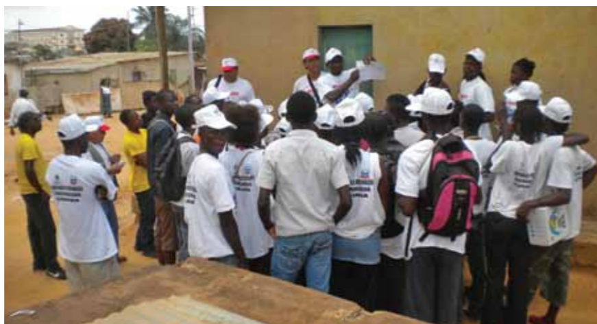
Vacinadores voluntários recebem instruções antes de iniciar a vacinação na comunidade

Em colaboração com as autoridades locais de saúde o nosso apoio