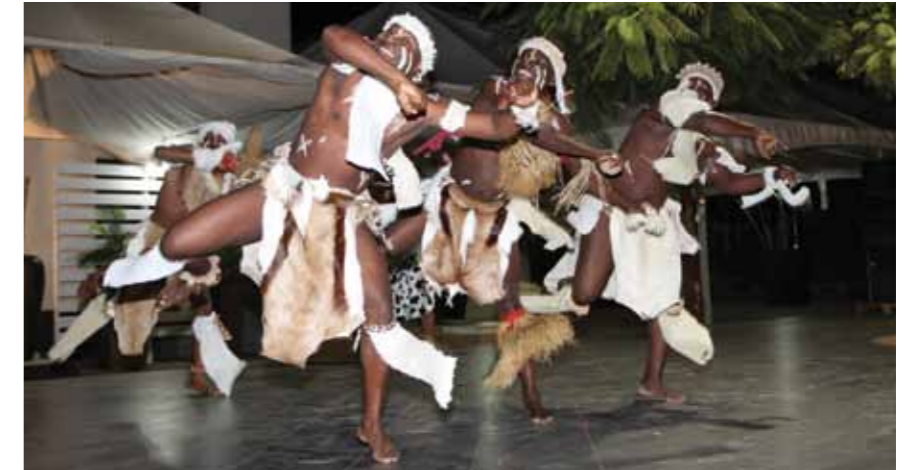
Actuação do Ballet Kilandukilu