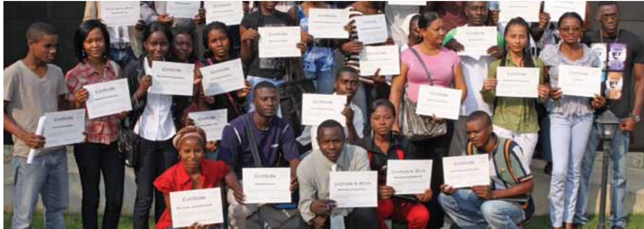
Estudantes de Cabinda exibem os seus certificados de bolsa de estudo