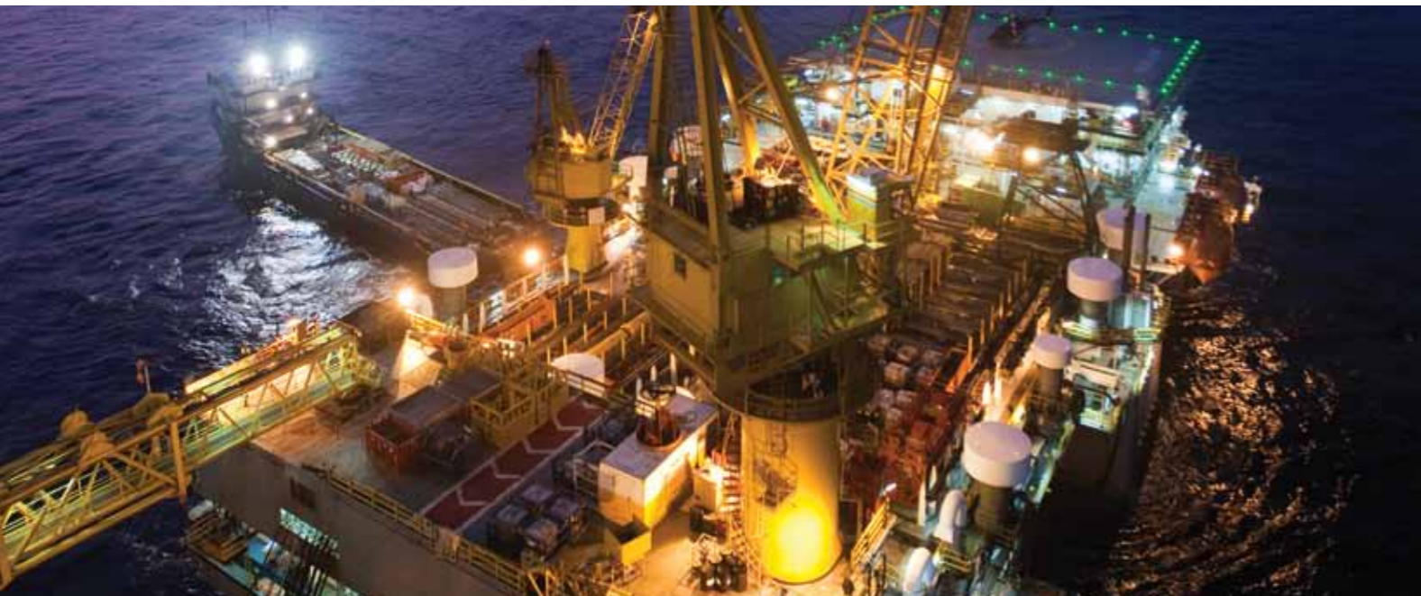
Plataforma Tómbua-Lândana, à noite