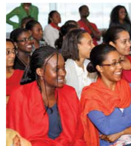
Os angolanos são 88 por cento da força de trabalho da Chevron no País