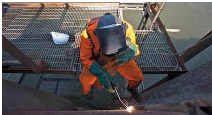
Na Chevron, a segurança é sempre uma prioridade