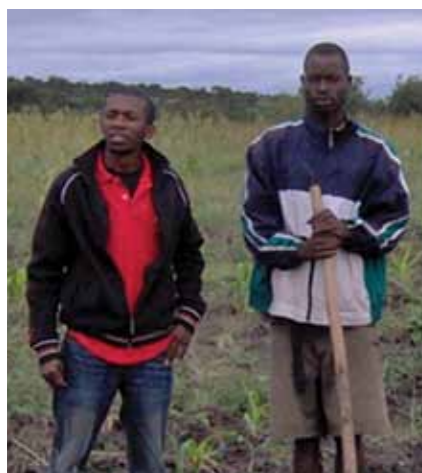
Camponeses da Associação Nova Wangué