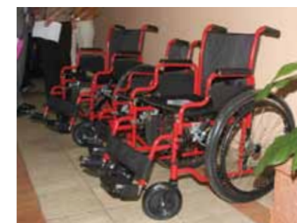
Doação de cadeiras de rodas ao Fundo Lwini