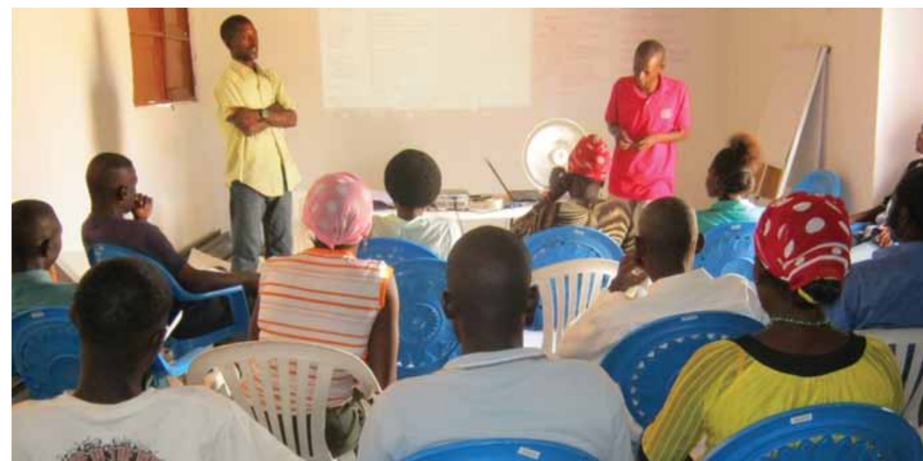
Participantes no PDM numa sessão de formação em advocacia social

A CABGOC atribuiu à Faculdade de Direito da Universidade Agostinho Neto condições para a produção de livros e outros materiais sobre Angola. A companhia premiou de igual modo os quatro melhores