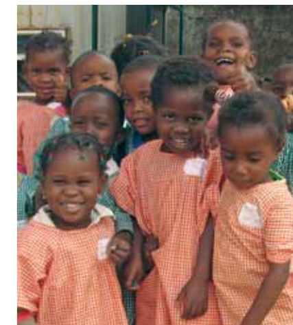
Crianças do Orfanato Pequena Semente

Doações de Alimentos em Cabinda: uma doação dos parceiros do Bloco O para a ajuda alimentar a mais de 500 crianças e idosos de várias instituições de caridade e orfanatos em Cabinda.